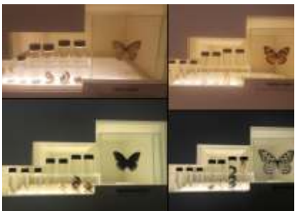
Kelebeklerin gelişimini zamana karşı tüplerde detaylı olarak görebiliyorsunuz.