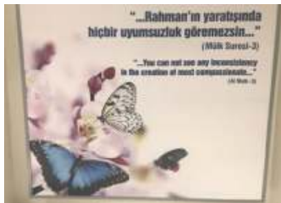
Mülk Suresinde dediği gibi yaratılan her şey bir uyum içerisinde...