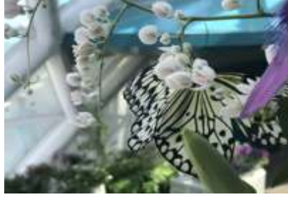
Idea Leuconoe (Paper Kite – Large Tree Nymph) kelebeği Güney Doğu Asya'da yaşamaktadır. Kanat açıklığı 150 – 170 mm'dir. Uçarken görüntüsü uçurtmaya benzediği için "Paper Kite" adı verilmiştir.