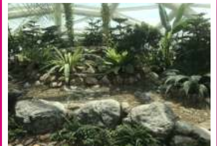
Ayrıca bahçede birçok farklı türde tropikal bitki bulunmaktadır: Besiz çiçeği, Fırça çalısı, Yarasa çiçeği, Duranta çiçeği, Floş İpek ağacı, Ebegümeciler ailesinden Çin gülü vb.