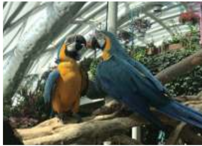
Tropikal Kelebek Bahçesinde sadece kelebekler bulunmuyor. Bu sevimli ve sürekli kavga eden papağanları da görebilirsiniz.