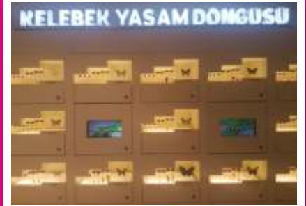
Kelebek Bahçesinde bulunan tüm kelebeklerin yaşam döngüsünü görebilirsiniz.