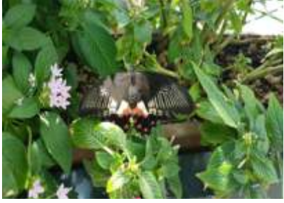
Papilio Mormon (Great Mormon) kelebeği ağırlıklı olarak Güney Asya'da yaşamaktadırlar. Kanat açıklıkları 140 – 150 mm büyüklüğündedir.