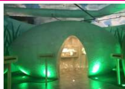
Böcek müzesinde farklı isimlerde odalar var ve her odada başka tür böceklerle ilgili detaylı bilgiler veriliyor: Karıncalar, arılar, peygamberdevesi, kırkanatlılar vs.