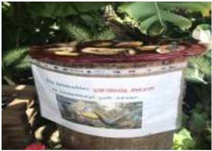
Genel olarak çürümüş meyve ile beslenmeyi seviyorlar. Farklı yerlerde kütüklerin üzerinde muz, elma, şeftali vb meyveler bulunuyor..