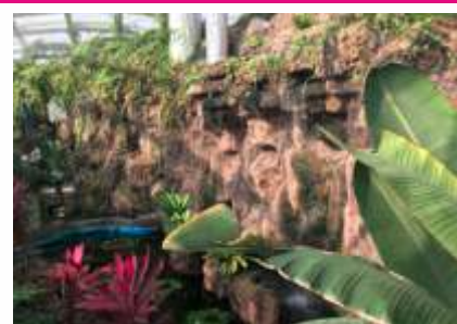
Besiz çiçeği, Fırça çalısı, Yarasa çiçeği, Duranta çiçeği, Floş İpek ağacı, Ebegümeciler ailesinden Çin gülü vb. pek çok tropikal bitkiyi burada görmek mümkün.