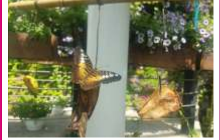
Güney doğu Asya, Sri Lanka, Güney Hindistan, Yeni Gine ve Solomon adalarında yaşayan Parthenos Slyvia (Clipper) çürümüş meyvelerle beslenmeyi sever. Hızlı uçuşu için kendisine Clipper (Süratli) adı verilmiştir.